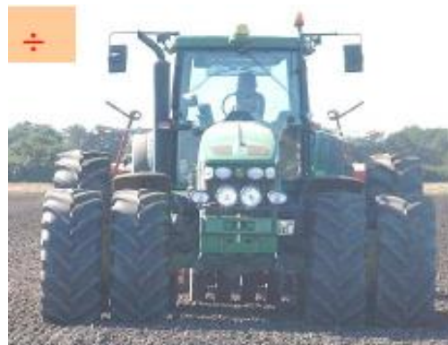
Rutiinien puuttuminen ja huono suunnitelmalisuus voivat johtaa väärinkäsityksiin